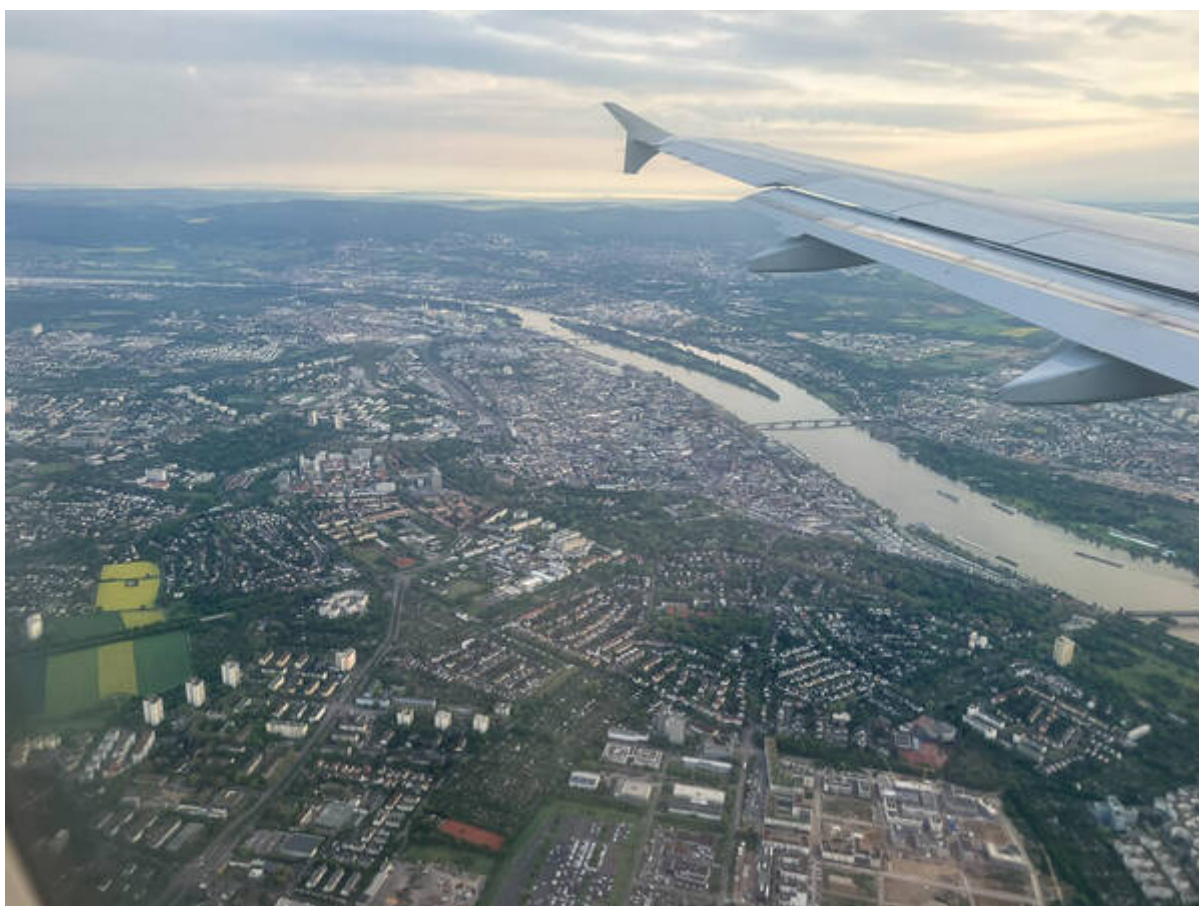
(Anflug über Mainz)

„Danke“ auf Armenisch wird in dieser Schrift so geschrieben: „Շնորհակալութիւնք“. Gesprochen: „Shnorhakat’yun“. Eine Kurzform davon gibt es nicht, da sagt man „Merci“.