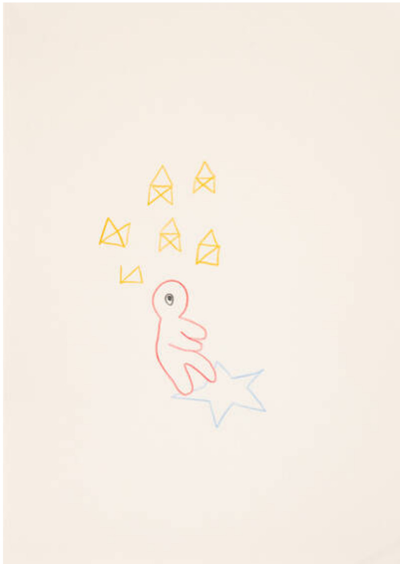
Im Osten des Westens (E-327-O-326)