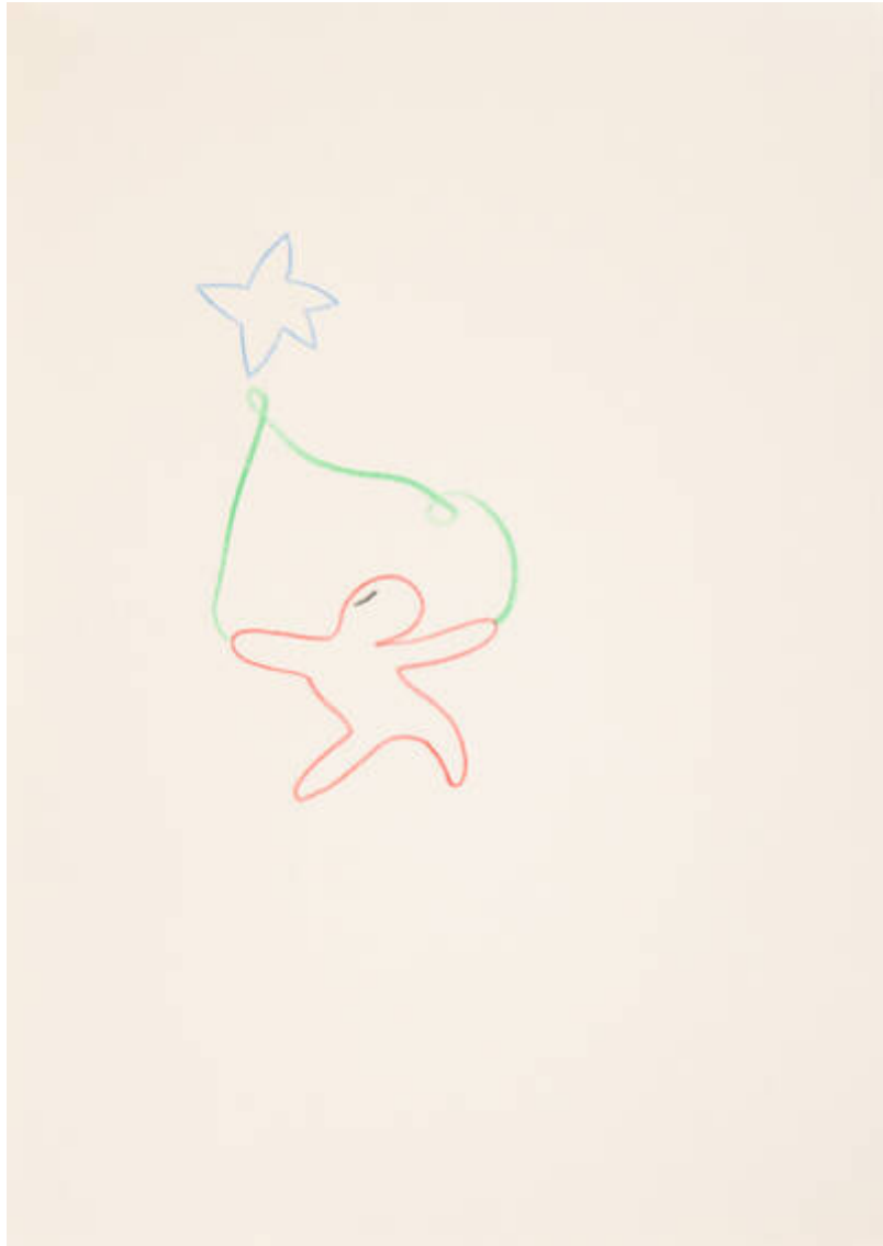
Im Osten des Westens (J-602-V-390)