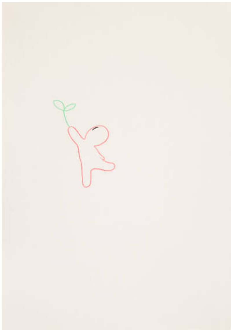
Im Osten des Westens (D-543-P-410)