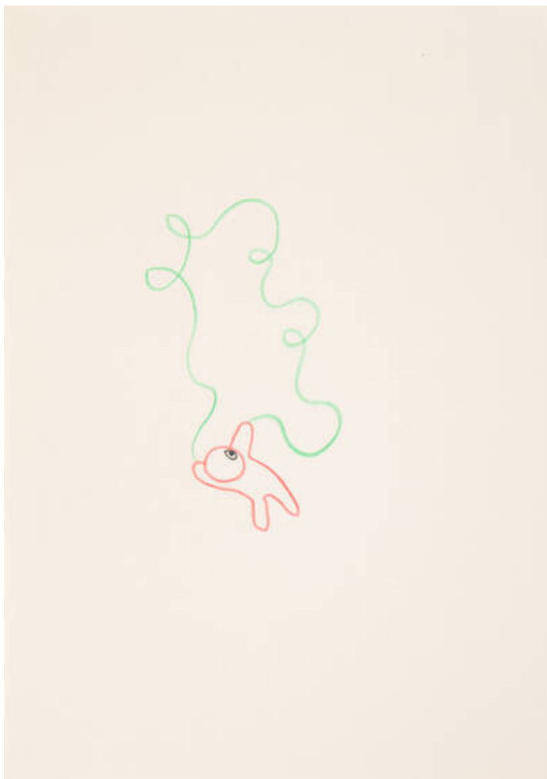
Im Osten des Westens (J-223-Y-390)