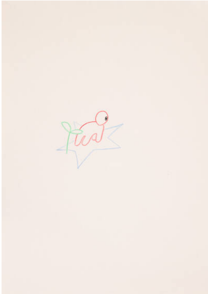
Im Osten des Westens (N-133-S-955)