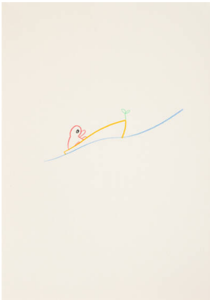
Im Osten des Westens (H-225-W-388)