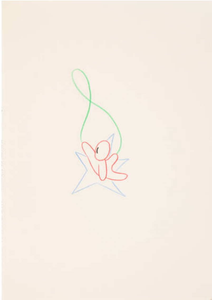
Im Osten des Westens (L-456-B-230)