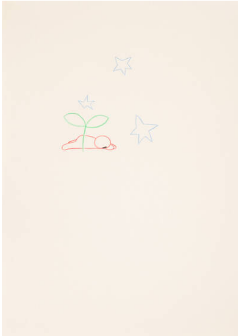
Im Osten des Westens (Z-133-F-501)