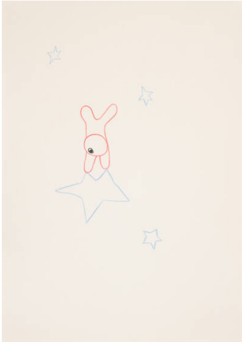
Im Osten des Westens (Q-188-V-301)