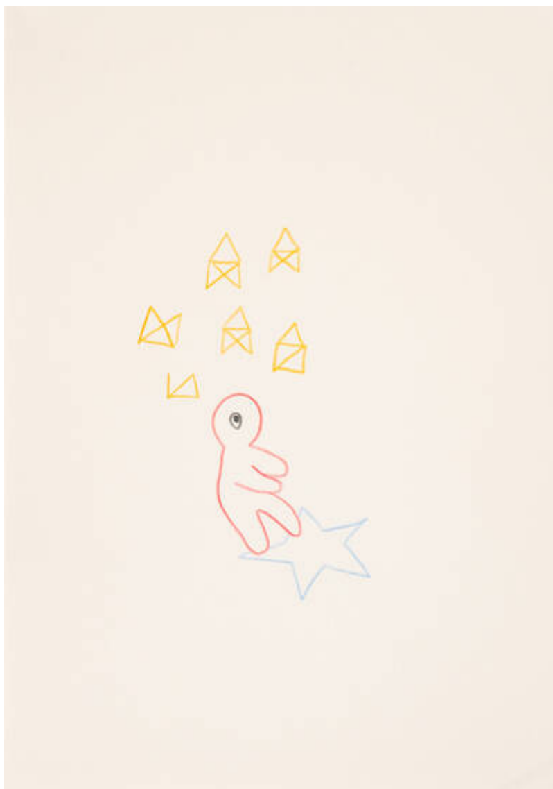
Im Osten des Westens (E-327-O-326)