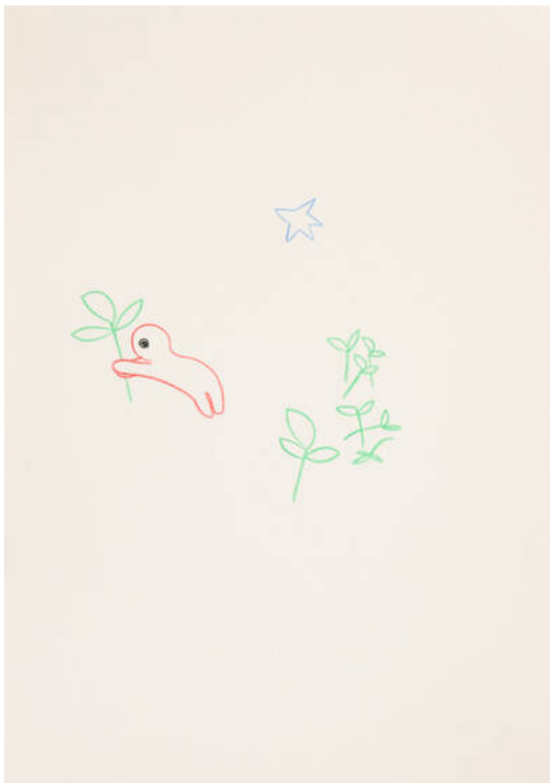
Im Osten des Westens (M-146-C-555)