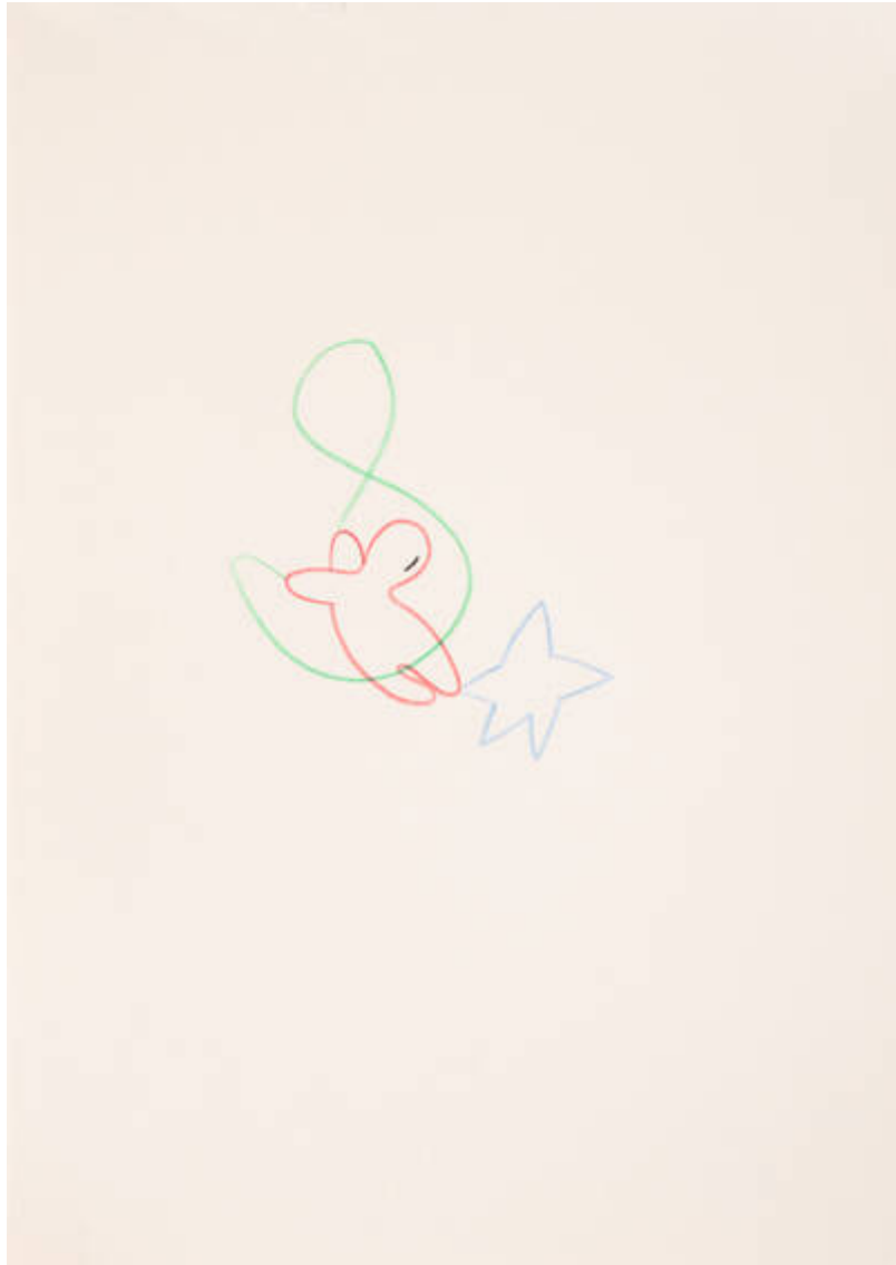
Im Osten des Westens ((I-224-X-389)