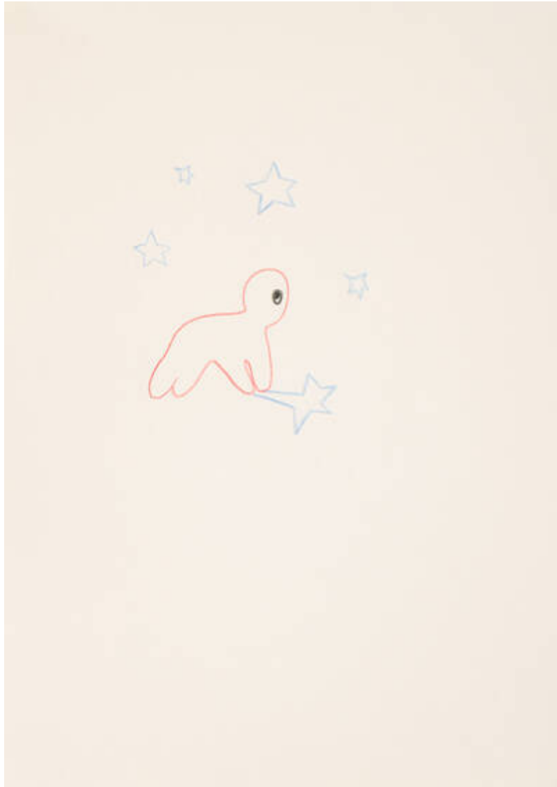
Im Osten des Westens (P-159-V-122)