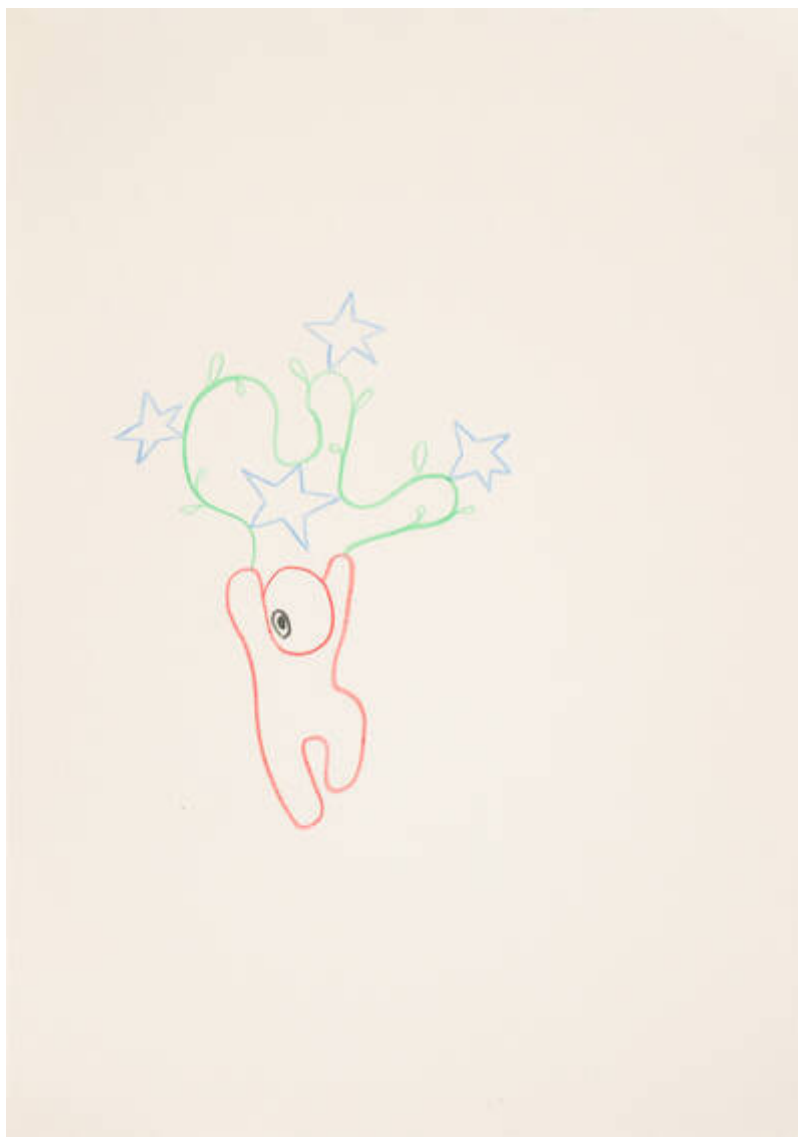
Im Osten des Westens (G-190-M-234)